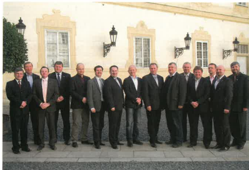
Hodnotící komise pro výběr CHAMPIONŮ 47. VVT.

Při slavnostním zahájení 47. Valtických vinných trhů vystoupí mužský pěvecký sbor vinařů pod vedením sbormistra Ctirada Králíka.