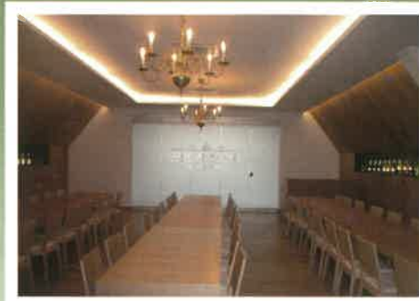
Zasedací místnost, Vinné sklepy Valtice, a.s.

Zakládáme si na kvalitě stavebních materiálů a spolupracujeme s certifikovanými systémy: YTONG (XELLA GROUP), POROTHERM (WIENERBERGER), HELUZ, KNAUF, NATURBLOCK, SCHIEDEL, SENDWIX, ISOVER, BACHL atd.