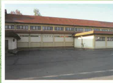
Vinné sklepy Valtice, a.s.