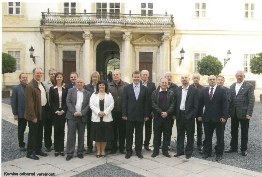
Komise odborné veřejnosti